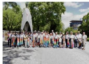
昨年の献呈の様子

折鶴献呈に向けて千羽鶴を募集しています。 折り紙は三和協働支援センターでも用意して います。みなさまのご協力をお願いします。 また、折鶴献呈へ参加希望の方も三和協働支 援センターまでご連絡ください。 ※バスの席に限りがあります。